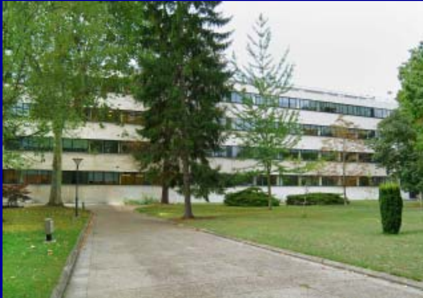
DE L'IFP BATIMENT HORTENSIAS.....